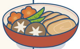
主菜 - 實支實付

健保主要滿足基本醫療需求，自費項目越來越多。實支實付根據醫療單據，限定額度內實報實銷，成為您自費負擔的「實在醫靠」！