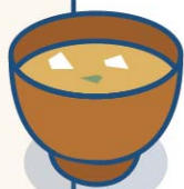
湯品 - 高齡保障

高齡時不僅需面對高昂醫療花費，恐也無經濟能力負擔額外保障。只有趁年輕打點好，年老時才能擺脫依靠子女的命運，擁有「加倍醫靠」！