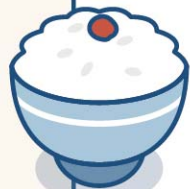
米飯 - 定額給付

住院時產生的隱形開銷您也要自掏腰包！定額給付可依住院日數申請固定保險金，醫療單據上看不見的花費，定額給付成為您的「醫靠」！